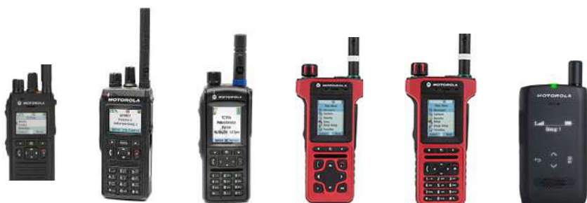
MTP3500 MTP3550 MTP6650 MTP8500 MTP8550 ST7000